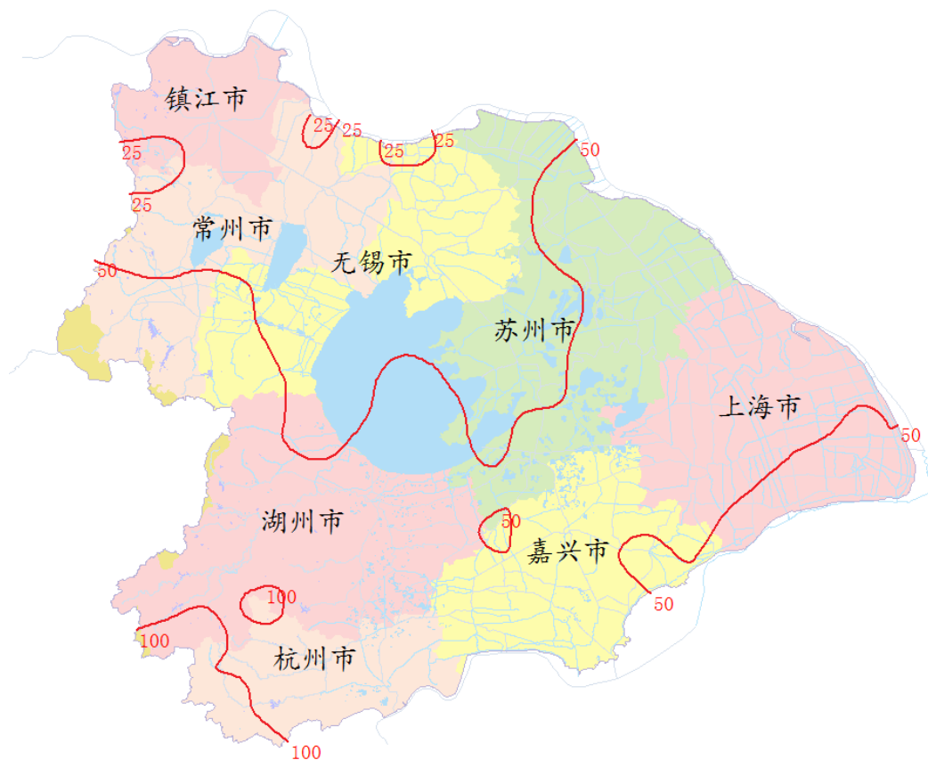
图 1 4 月份太湖流域降雨量等值线图

4 月份太湖流域降雨量 54.3mm，较常年同期偏少 47%。流域上、中、下旬降雨量分别较常年同期偏少 51%、59%和 34%。空间分布从流域南部向北部递减，各分区较常年同期偏少 21%~61%（见表 1）。最大点雨量为浙西区桥东村站 105mm。4 月份太湖流域降雨分布情况见图 1。