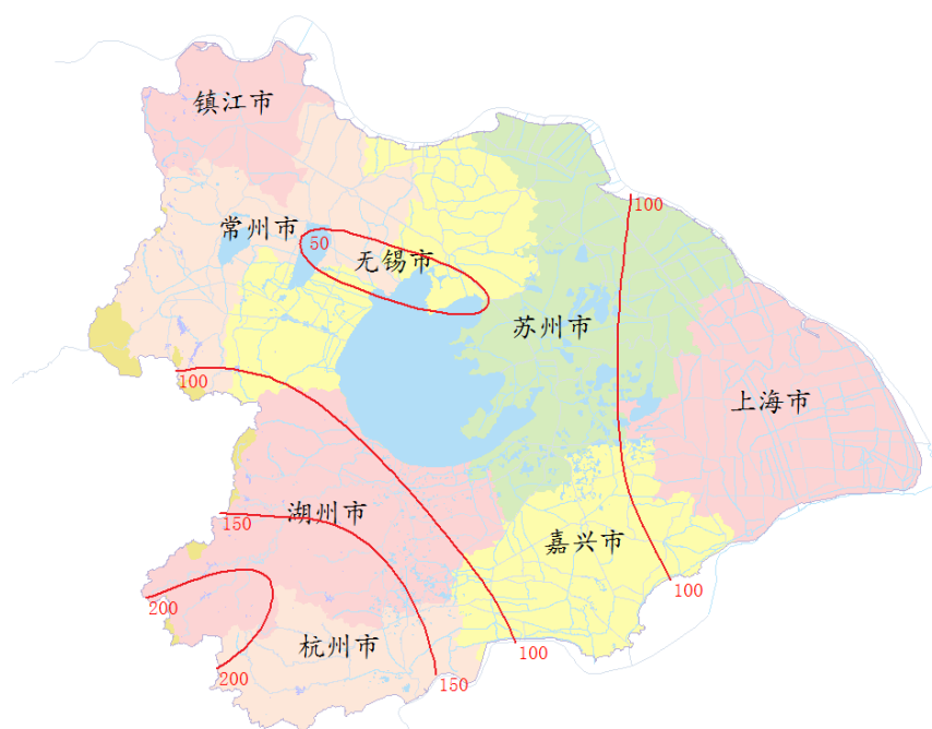
图1 9月份太湖流域降雨量等值线图

9月份，太湖流域降雨总量为93.9mm，较常年同期偏少20.1%，上、中、下旬较常年同期分别偏少39.0%、8.7%和5.0%。各水利分区降雨量较常年同期均偏少，其中，太湖区、武澄锡虞区和湖西区偏少41.5%、32.9%和31.6%，其他分区偏少7.4%~22.4%（见表1）。最大点雨量为浙西区的董岭站275.0mm。9月份太湖流域降雨空间分布情况见图1。