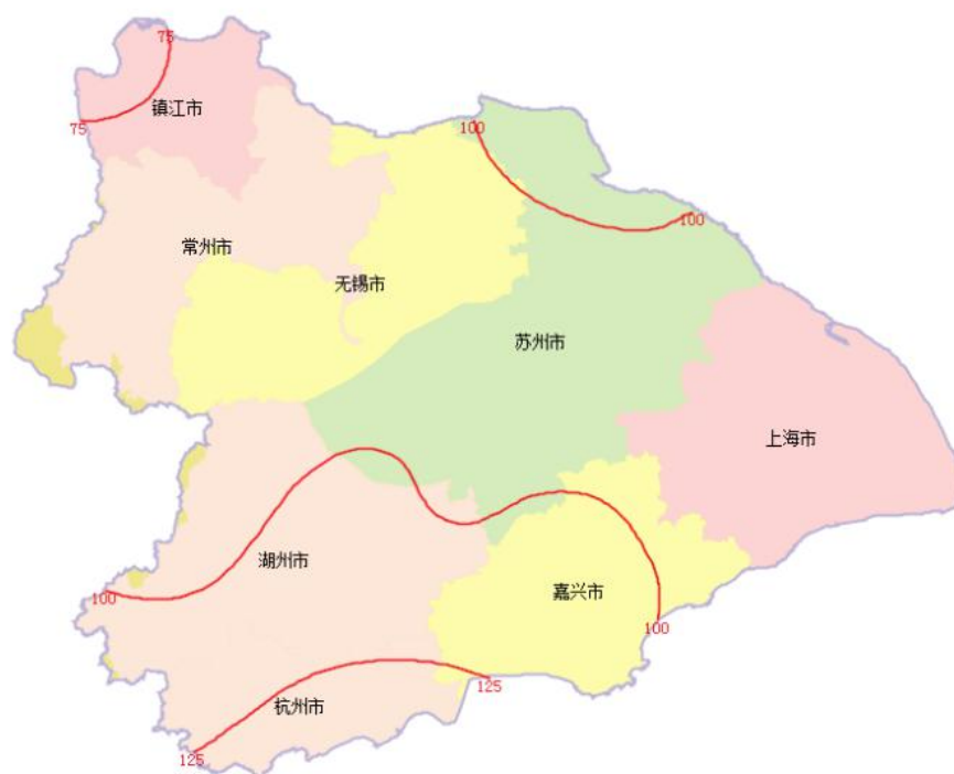
图1 2018年11月太湖流域降雨量等值线图

11月，太湖流域平均降雨量93.7mm，较常年同期偏多达63.5%，上旬、中旬偏多103.6%、138.1%，下旬偏少78.3%。降雨主要集中在5—7日、17—18日和20日，6天降雨量累计达78.1mm，占月雨量的83.4%；降雨空间分布总体呈南部大于北部，各水利分区中降雨量最大的为杭嘉湖区117.5mm，最小的为浦东浦西区77.8mm；各水利分区降雨量均较常年同期偏多，偏多幅度为43.0%~94.2%（见表1）。最大点雨量为杭嘉湖区的闲林水库站164.5mm。11月份太湖流域降雨分布情况见图1。