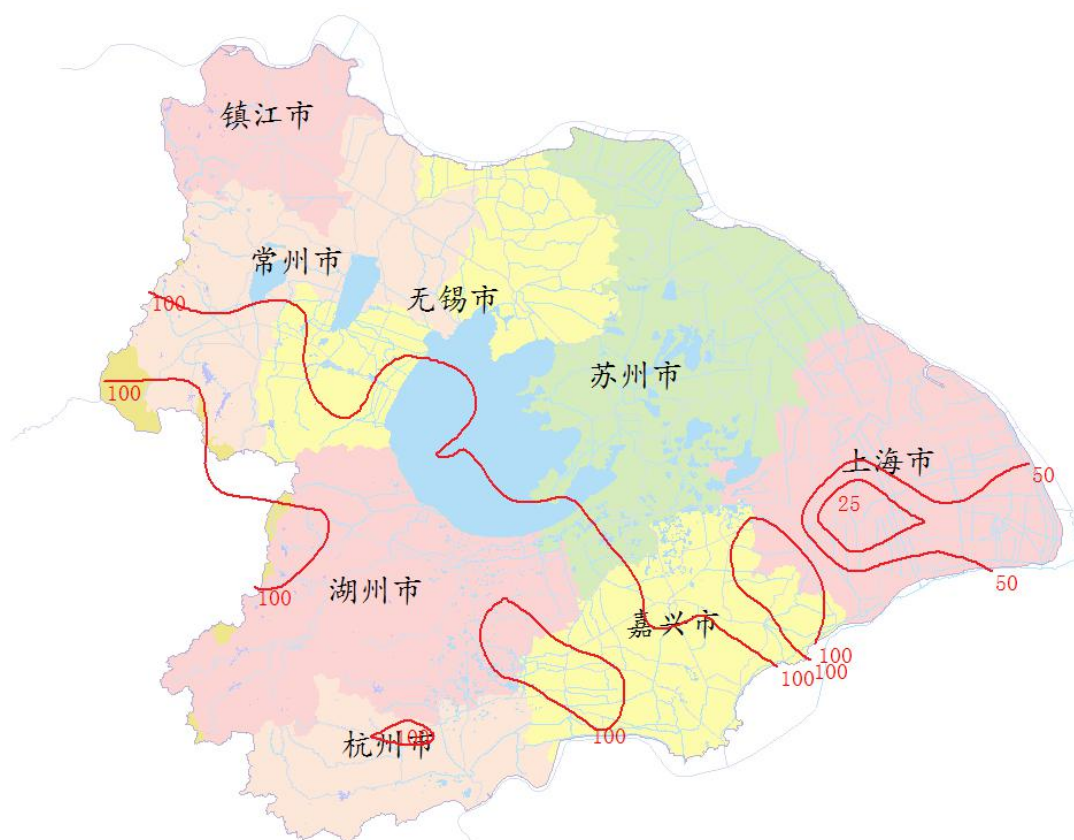
图 1 2 月份太湖流域降雨量等值线图

2 月份太湖流域降雨量 90.2mm，较常年同期偏多 37.3%。流域上旬和中旬降雨量分别较常年同期偏多 35%和 86%，下旬降雨量较常年同期偏少 11%。空间分布南部大于北部，各分区较常年同期偏多 13%~49%（见表 1）。最大点雨量为湖西区横山水库站 127.7mm。2 月份太湖流域降雨分布情况见图 1。